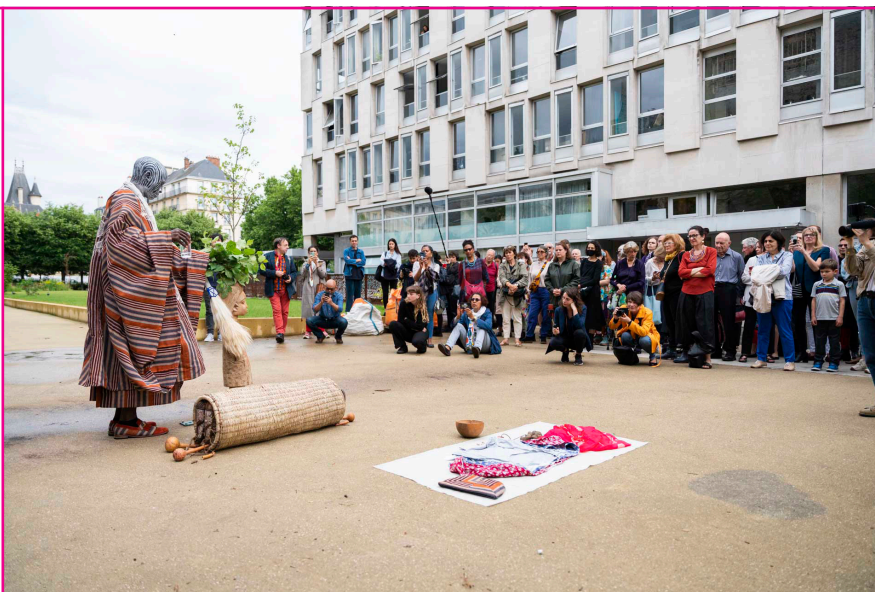
Performance de Jelili Atiku, Cité internationale des arts, Entrelacs , juillet 2022

Le programme détaillé à consulter sur le site web de la Cité internationale des arts.