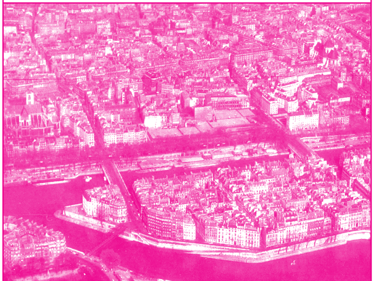
Vue aérienne de Paris, circa 1960

Les Scénos Urbaines collaborent de longue date avec la Cité internationale des arts, notamment via des manifestations imaginées avec l'historienne de l'art et commissaire Dominique Malaquais ( Les Utopies performatives , 2021 ; Entrelacs , 2022...).