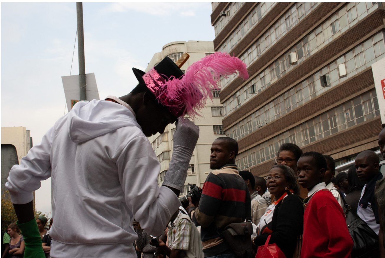
Scénos Urbaines Johannesburg, Zen Marie, The Red Carpet , 2009 © Sammy Baloji