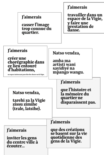
Catalogue Scénos Urbaines Mayotte, J'aimerais , 2023 © Jean-Christophe Lanquetin