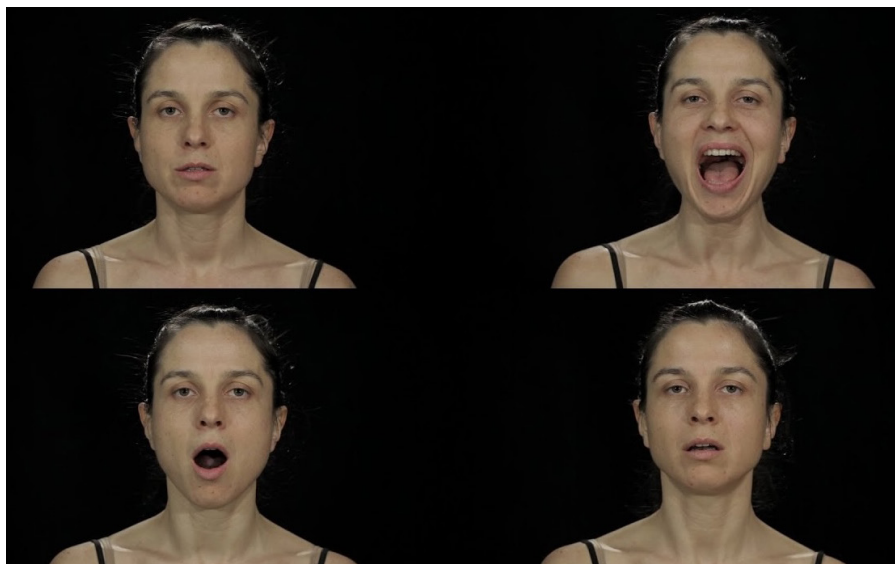
Irena Z. Tomasin, Faces of Voices / Noise , 2015 Vidéo, couleur, son, 21 min 50 s Commandée et produite par : MoTA - Museum of Transitory Art Avec l'aimable autorisation de l'artiste