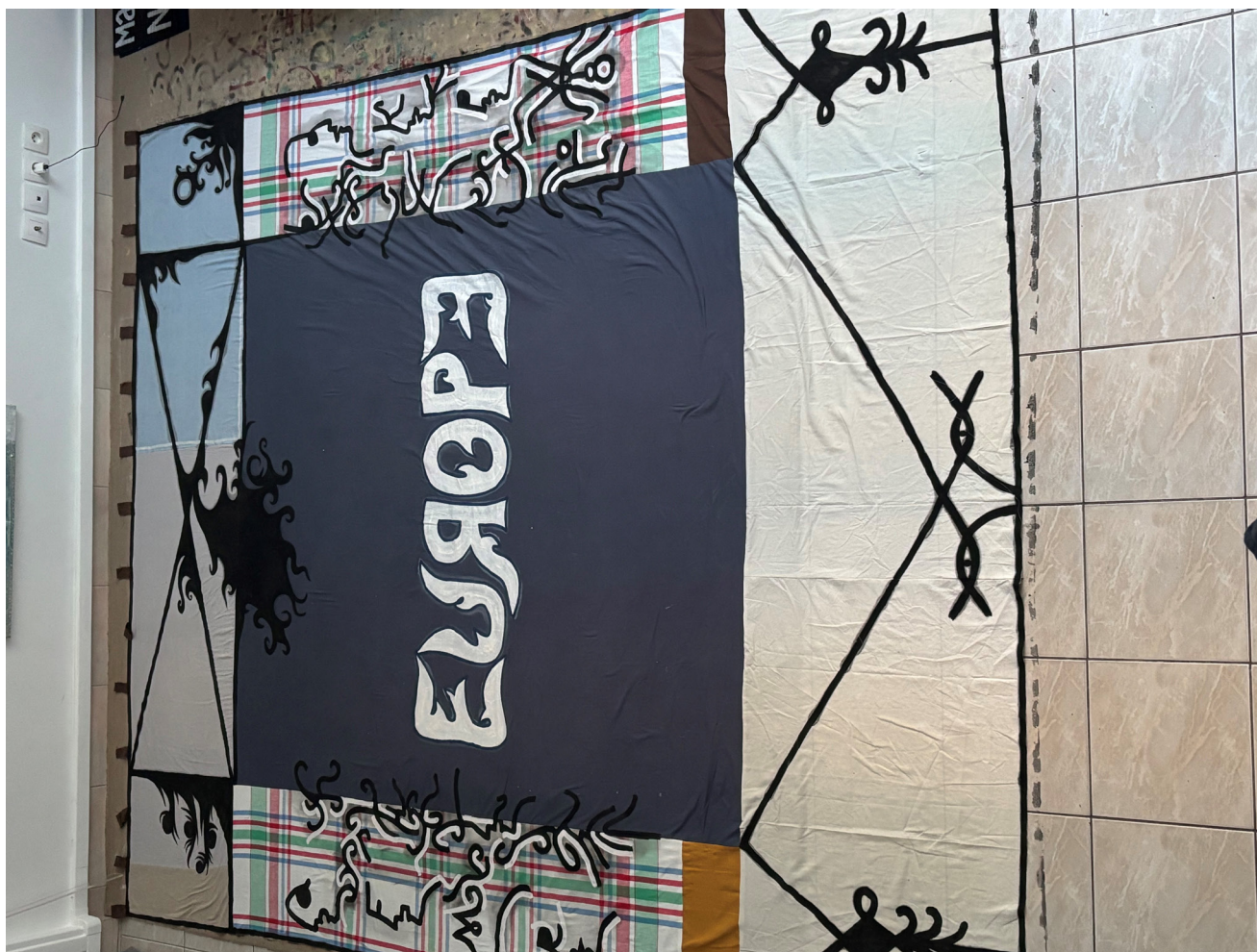
Babi Badalov, Multiculturalism is Failed (Angela Merkel) , 2026 Acrylique sur textile