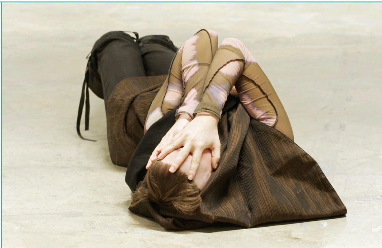
Tilhenn Klapper, Lament , Menagerie de verre, Paris, 2025

Le programme détaillé à consulter sur le site internet de la Cité internationale des arts.