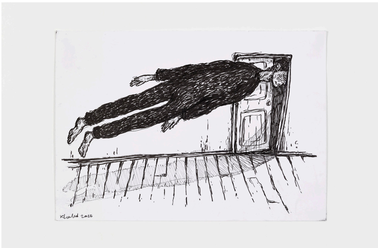
Khaled Jarada, 2025 Dessin Avec l'aimable autorisation de l'artiste