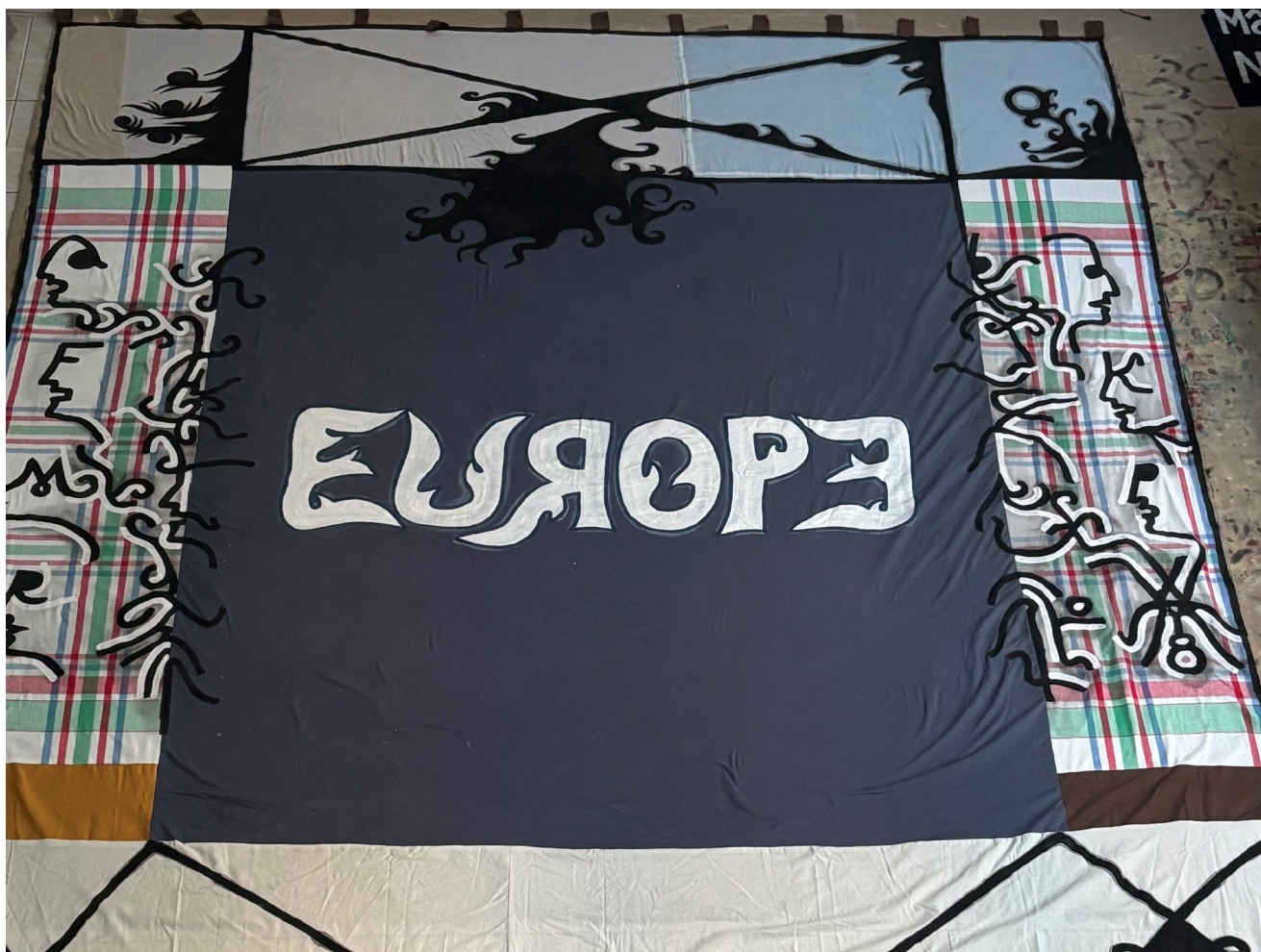
Babi Badalov, Multiculturalism is Failed (Angela Merkel) , 2026 Acrylique sur textile