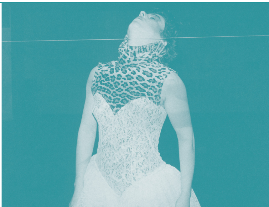
Judit Kele, Csókolom – baiser sur la bouche , 1985 Performance avec Pilar Romero de Castilla Avec l'aimable autorisation de l'artiste © D.R.

Judit Kele est une artiste et réalisatrice hongroise installée à Paris depuis 1981. Au début des années 1980, elle présente ses performances dans diverses institutions artistiques. Elle participe à la dernière Biennale de Paris en 1985 avec Csókolom , puis s'éloigne du milieu des arts visuels pour se consacrer à la réalisation de films, principalement des portraits de figures majeures de la musique et de la culture.