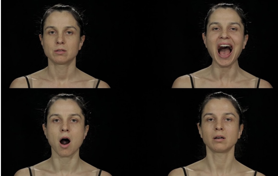
Irena Z. Tomasin, Faces of Voices / Noise , 2015 Vidéo, couleur, son, 21 min 50 s Commandée et produite par : MoTA - Museum of Transitory Art