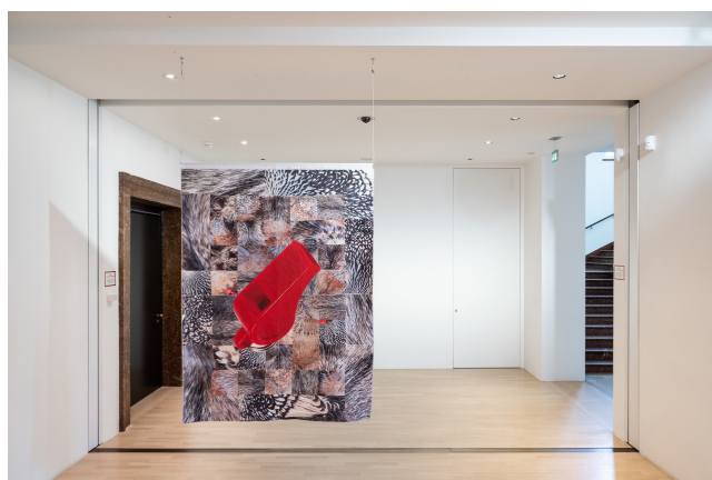
Natascha Sadr Haghghian, vue de l'installation Now that I can hear you my eyes hurt , 2023 Bannière en tissu brodée, poulie, corde En collaboration avec Zeynab Izadyar