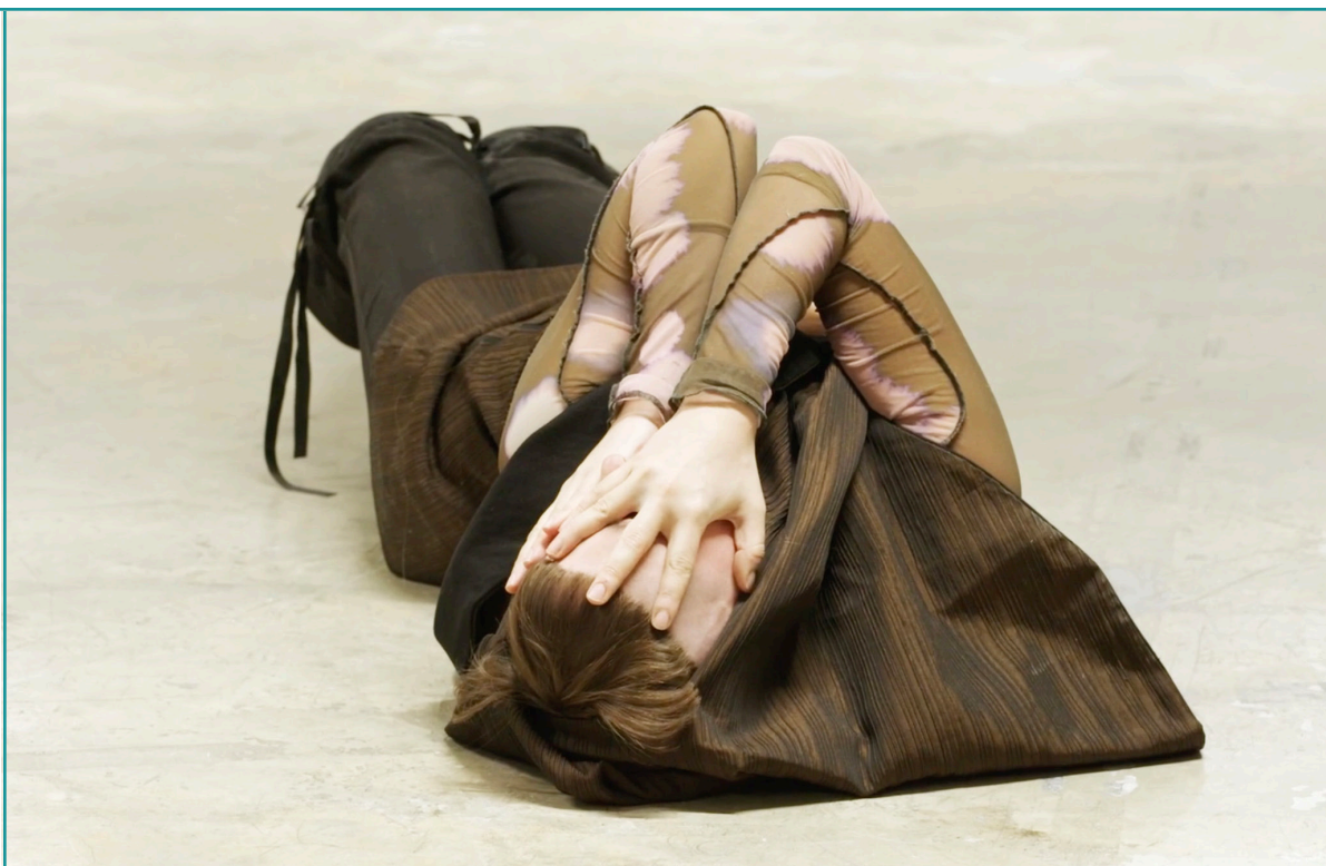
Tilhenn Klapper, Lament , Menagerie de verre, Paris, 2025

Le programme détaillé à consulter sur le site internet de la Cité internationale des arts.