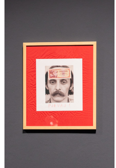
Mladen Stilinović, PJEVAJ! / SING! , 1980 Collage, pastel, photographie en noir et blanc, billet de banque sur soie artificielle, 41 x 32 cm